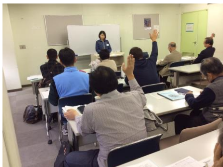
写真 19 A 1 (2)グループ代表