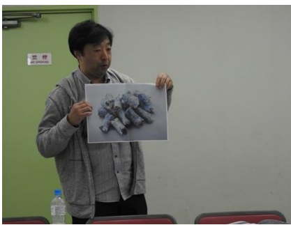
写真 11A2グループ : 環境経営