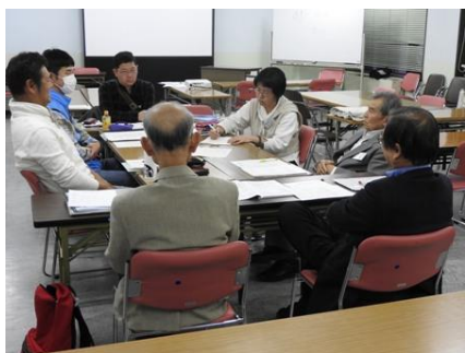
写真 10A 1グループ : 地球環境