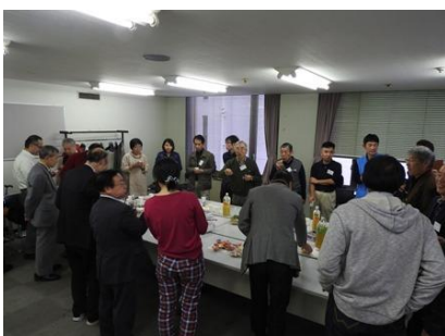
写真 1 4