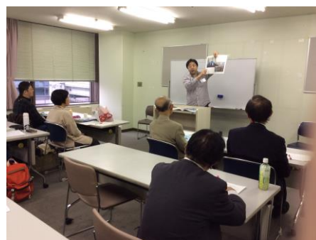
写真 18 A 2グループ代表