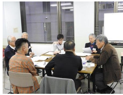
写真 12Bグループ : 自然環境