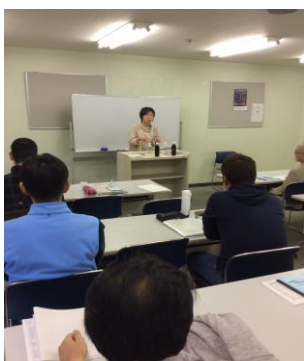
写真 17 A 1 (1)グループ代表