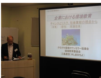
写真9 企業の事例 (三島講師)