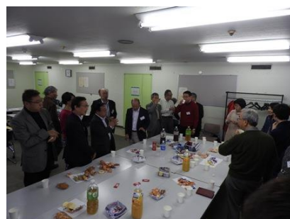
写真 1 5