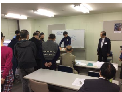
写真 16 Bグループ代表