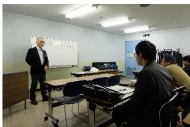
写真17 模擬授業 A1 グループ：地球環境