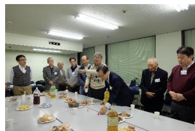
写真16 交流会実施風景