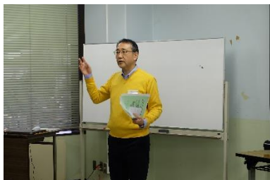
写真10 日吉講師 ワークショップの進め方