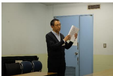
写真 2 1 日吉講師 提出書類等説明