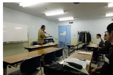
写真19 模擬授業 B グループ：自然環境