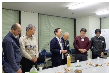
写真15 交流会実施風景