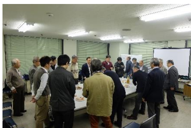
写真14 交流会実施風景