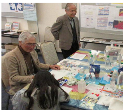
好きなキャラクターに夢中で色塗りをしている少女

2019年10月5日(土)に「ちがさき環境フェア2019」、11月9日(土)に「ふじさわ環境フェア2019」が開催されました。KECA 湘南支部は、今年も例年通りパネル展示とワークショップを行いました。