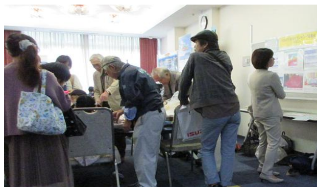
ペットボトルに風船を取り付けるのを手伝っている KECA のメンバー

スタッフ：嶋田、西村、中本、小山4名(ちがさき環境フェア)、嶋田、西村、中本、小川、小山5名(ふじさわ環境フェア)