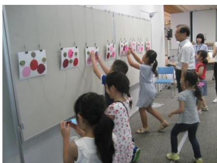
中央区：おなもみの的当てゲーム

8月11日には品川区環境情報活動センターで「水の力、水の不思議の自由研究」に5名のメンバーが品川区の親子34名を対象に協力支援しました。