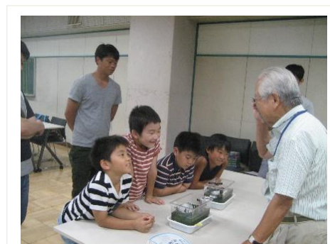
品川区：北極・南極モデルで夏の氷がどうなるか？実験