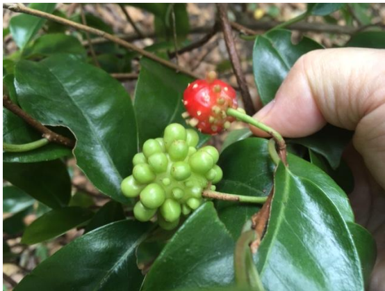
さねかずらの青い実と赤い実

この時期の見どころは木の実である。紅葉にはまだだがカラスウリ、さねかずら、ムラサキシキブ、いいぎりなど深紅のものからピンクのものが見ごろであった。説明員からは下草でキチジョウソウ、カンアオイ、アワコガネギクなど紹介してもらったが皆初めて知ったようだった。