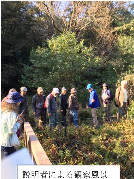
説明者による観察風景

園内は針葉樹、落葉樹、常緑樹が極相林となり松・スダジイ・もみ・椋木などの古木、大木が目立つ。