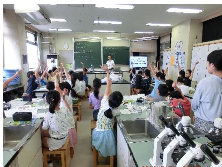
中川小学校：魚の大きさクイズ

中川小学校では、既に一次産業（水産業）の授業を受けていたので、生徒が楽しんで、学んでいました。中丸小学校では低学年が多かったので、海の環境悪化を招いているポイ捨てをしないことを教え、更に食べ残しを減らすための紙芝居を行いました。