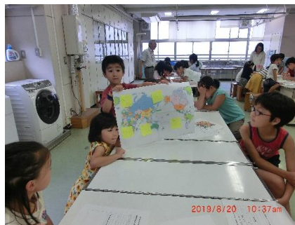
中丸小学校：魚の産地を世界地図に書いた